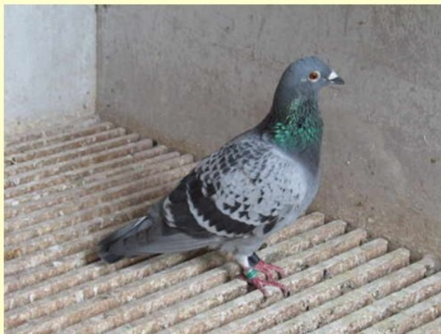
Orion vlak na thuiskomst Bergerac.

1e getekende: 01-1110402 Saffier (eitjes 16 dgn)