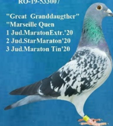
"New Queen "

"Marseille Quen 1 Jud.MaratonExtr.'20 2 Jud.StarMaraton'20 3 Jud.Maraton Tin'20